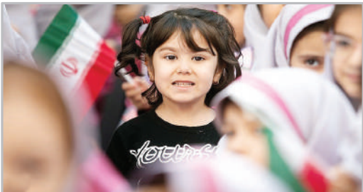
آغاز سال تحصیلی دانش‌آموزان کلاس اولی