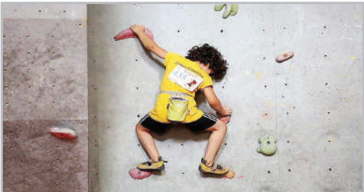
مسابقات سنگ‌نوردی قهرمانی نونهالان و نوجوانان کشور