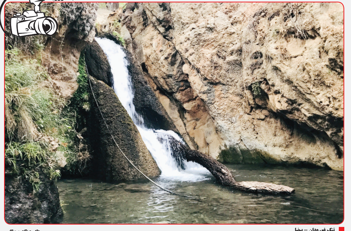
تنگ غوره‌دان - یسنا