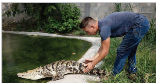
مرد مکزکی که گونه‌های مختلف تمساح را در خانه اش نگهداری می‌کند