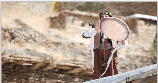
اجتماع بزرگ دفن‌نویان - کردستان