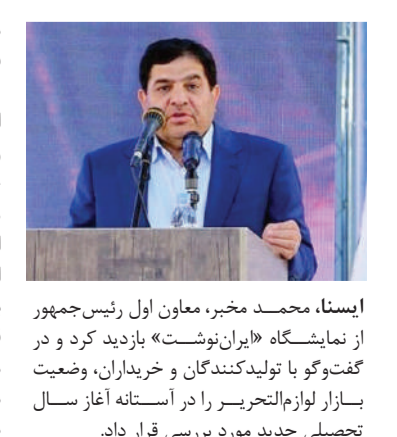
ایسنا، محمد مخبر، معاون اول رئیس‌جمهور از نمایشگاه «ایران نوشت» بازدید کرد و در گفت‌وگو با تولیدکنندگان و خریداران، وضعیت بازار لوازم‌التحریر را در راستای آغاز سال تحصیلی جدید مورد بررسی قرار داد.

معاون اول رئیس‌جمهور در محل کانون پرورش فکری کودکان و نوجوانان حضور یافت و از غرفه‌های مختلف نمایشگاه لوازم‌التحریر ایرانی «ایران نوشت» بازدید کرد.