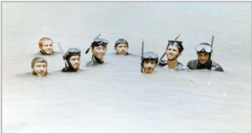
به مناسبت هفته دفاع مقدس